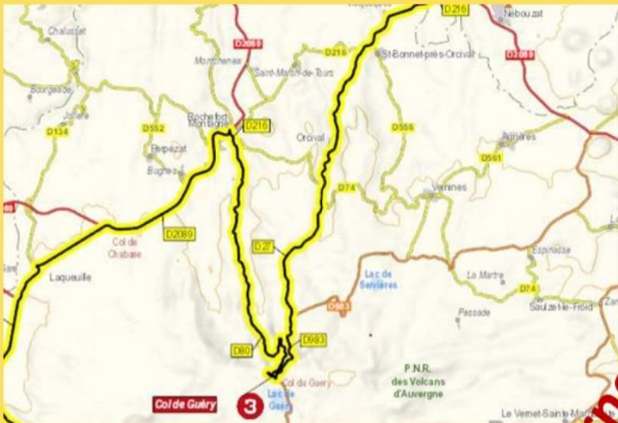
Tracé du Tour de France dans le secteur de Rochefort-Montagne

Le mythique Tour de France passera par Rochefort-Montagne le 11 juillet 2023